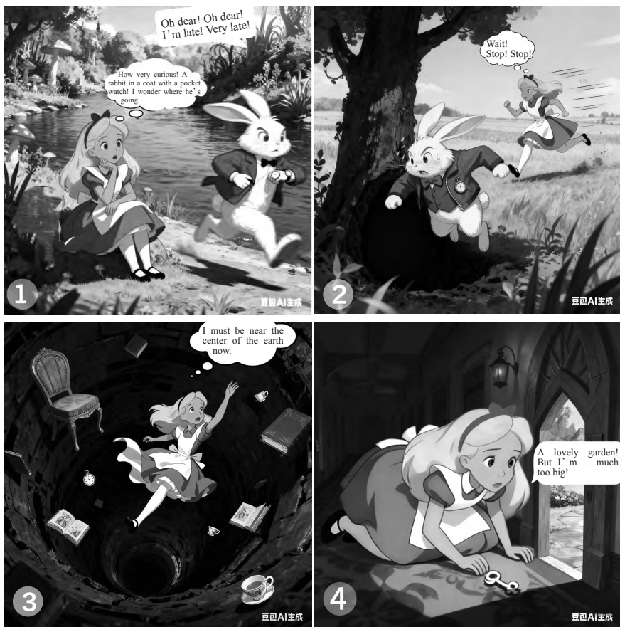
图2 Chapter 1 Alice goes down a rabbit hole 的四格漫画

第四步,精准出图与版式选择,强化场景适配性。教师在豆包中输入包含分镜描述、角色设定、画面提示词、构图与视角四大核心要素的指令,生成四格漫画(如图2所示)。