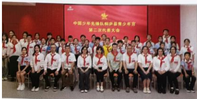
中国少年先锋队桐庐县青少年宫第二次代表大会