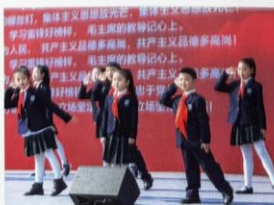
学习雷锋好榜样知识宣讲