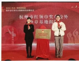
杭州市红领巾奖章“校外争章基地”揭牌