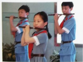
少先队员进行才艺展示