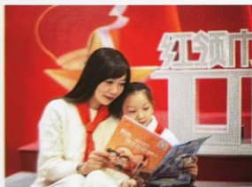
辅导员和少先队员一起阅读队刊