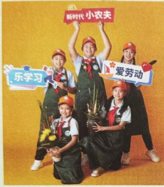
封面队活动： 乐学习 爱劳动 新时代“小农夫”在行动

上海市青浦区淀山湖小学少工委积极发挥学校劳动教育特色，利用校内外劳动教育资源，打造丰富多元的劳动实践基地，队员们在乐学习、爱劳动中学本领、长知识。