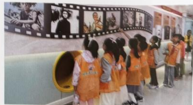
少先队员参观英雄出少年知识展