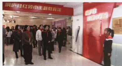
红领巾讲解员进行“党团队”知识讲解