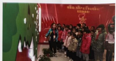
红领巾讲解员在进行“我们的校外活动场馆”介绍