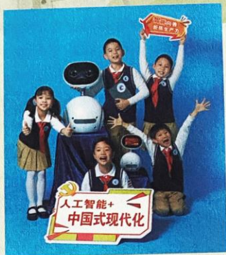
封面队活动： 数智赋能 幸福“+”速度

“你有没有完成入队知识大闯关呀？”“‘小浪花’给我支的招太有用了！”在上海市虹口区曲阳第四小学的少先队队室里，红领巾小辅导员与二年级队员正围坐在智能机器人“小浪花”的周围热烈地讨论着。