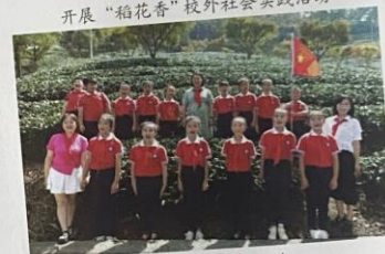
湄潭县浙大小学 少先队员探寻茶叶奥秘