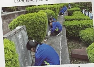
赤水市第二中学组织少先队员 到赤水红军烈士陵园扫墓