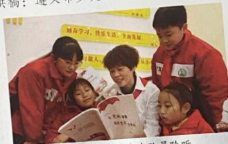
正安县第八小学少先队员聆听 《党的故事驻进万少年心》