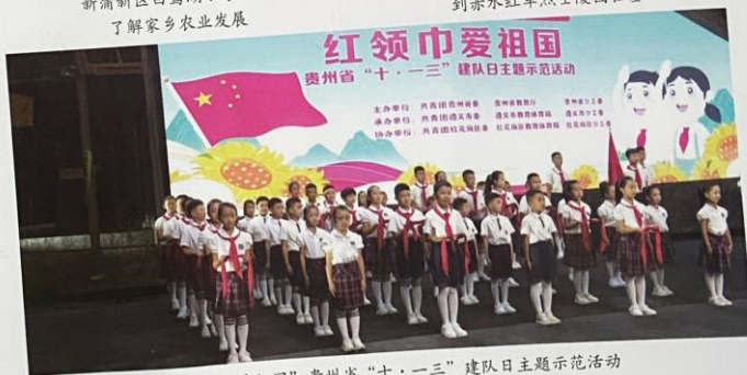
“红领巾爱祖国”贵州省“十·一三”建队日主题示范活动