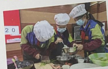
遵义市汇川区第六小学 组织少先队员在劳动竞赛中练就本领