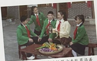
遵义市文化小学官井校区少先队员沿着 习近平总书记视察花茂村的路线寻访