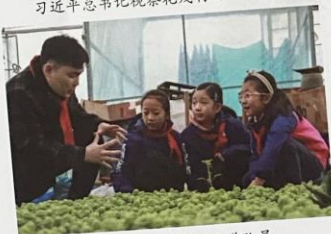
新蒲新区白鹭湖小学队员 了解家乡农业发展