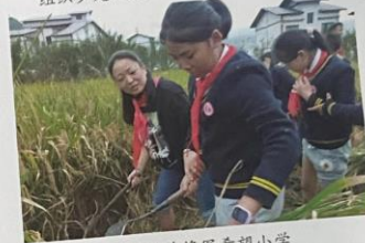
娄山关将军希望小学 开展“稻花香”校外社会实践活动