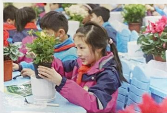
宜兴市城南实验小学 开展“我是环保小卫士”活动