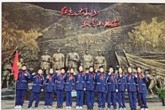
宜兴市东沈小学 开展“我是小小追梦人”活动