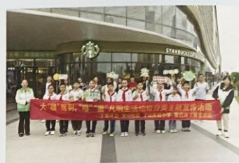
宜兴市丁山实验小学 开展“垃圾分类”宣传活动

从“小五年计划”到“小五年规划”，宜兴少先队用自己的行动证明，新时代的红领巾不仅有着对祖国的深厚情感，更有着为实现中华民族伟大复兴而不懈奋斗的决心和勇气。