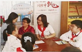
宜兴市实验小学 开展“走近‘小五年计划’”主题寻访活动