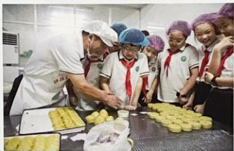
从“学习者”到“践行者”， 带领少先队员参与实践体验