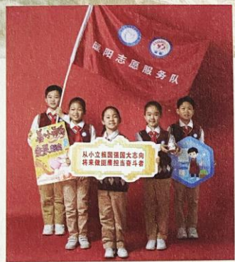
封面队活动： 15年公益服务，微光薪火相传

上海民办彭浦实验小学“雷锋公益服务队”的公益志愿服务已经走过了第15个年头，“爱润彭实”公益行动是每位队员五年成长的必修课。