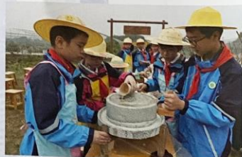
宜兴市蒋南翔实验小学 开展“走进秋收节”活动