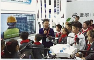
宜兴市经济技术开发区实验小学 开展“我是创新小达人”活动