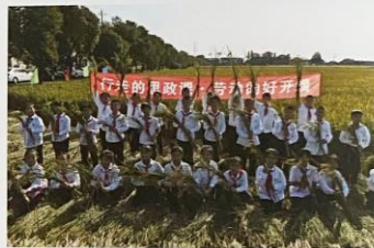
宜兴市宜丰小学 开展“我是劳动小能手”活动