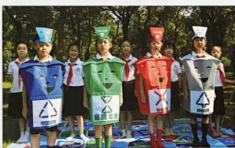
从“聆听者”到“传播者”， 引导少先队员践行志愿服务