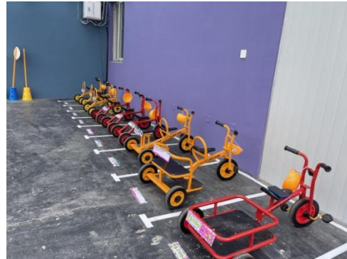
(3) 发放驾照，上路都是小司机

活动中孩子们发现，经常会发生拥堵的情况，而造成这个情况的就是车技不熟练，看来好的车技也是我们骑行游戏必不可分的一部分。车技要如何锻炼和体现呢？